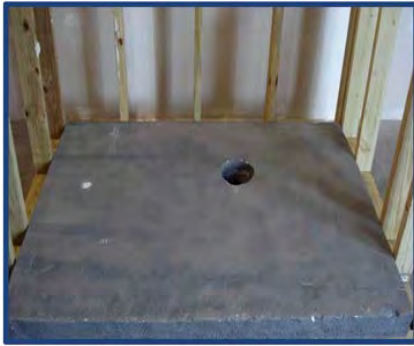
Fotografía de instalación 1