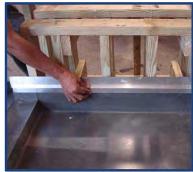
Fotografía de instalación 4