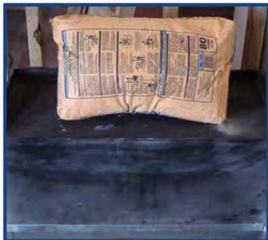
Fotografía de instalación 7