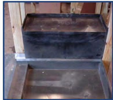
Installation Photo 6