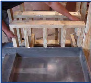
Fotografía de instalación 3