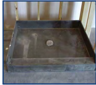
Fotografía de instalación 2