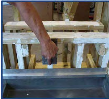
Fotografía de instalación 5